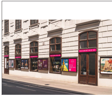
Palais Lobkowitz Pop Up Außenansicht