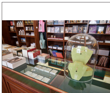
Palais Lobkowitz Pop Up Innenansicht